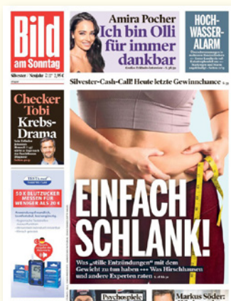
BILD am Sonntag

BILD am Sonntag bietet aktuelle Nachrichten und exklusive Interviews aus Politik, Unterhaltung, Wirtschaft und Sport. Als kritischer Beobachter, Sportreporter und Ratgeber für alle Lebensbereiche setzt Deutschlands größte Sonntagszeitung bereits am Sonntag die Themen, über die Deutschland in der Woche spricht.